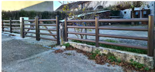
Barrière & portail