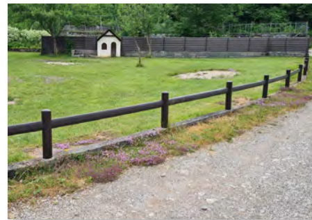
Barrière séparative 1 lice

Se travaille aussi bien que le bois. Fixation des poteaux directement dans le sol avec un préperçage ou par scellement.