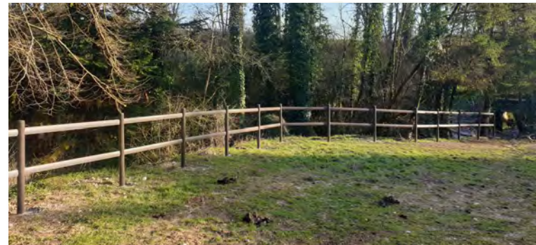
Barrière Parc chevaux