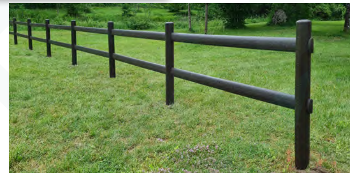
Barrières de sécurisation - 2 lices encastrées