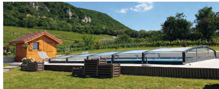
Bardage de piscine