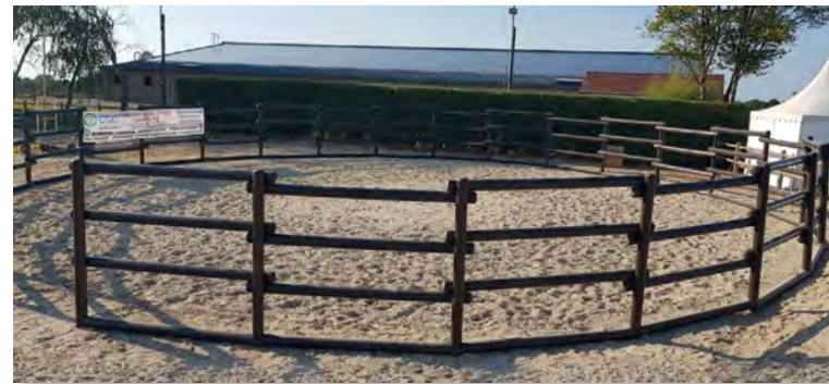
Rond de longe