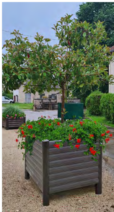
Bac jardinière 80x80x50cm