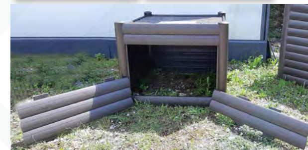
Composteur individuel 500L