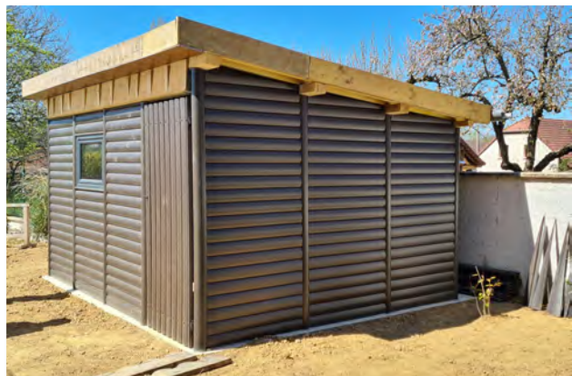
Abri de jardin