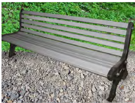
Lames de banc