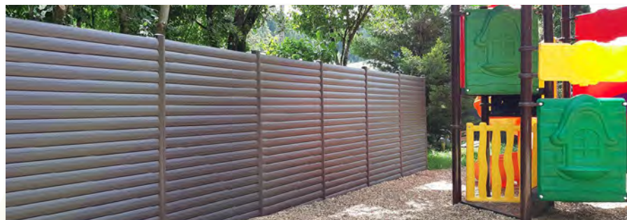
Palissade aire de jeux - Camping de la Petite Montagne