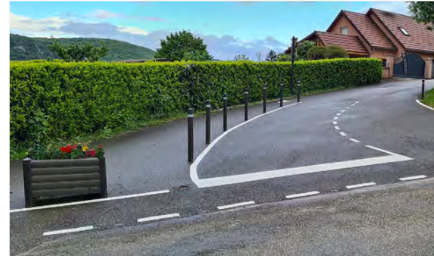
Balisage en bord de route