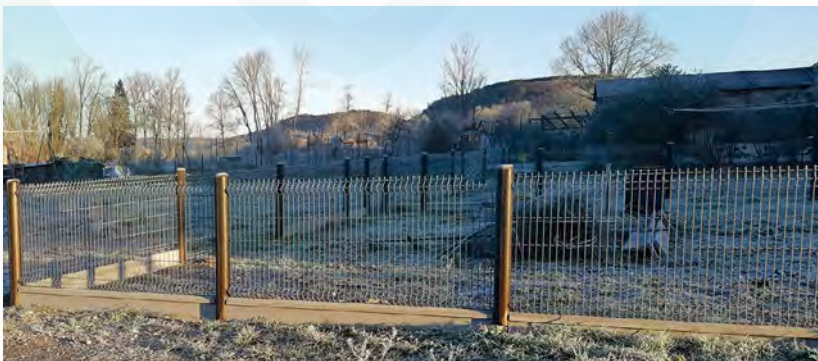
Clôture grillagée avec embase ciment