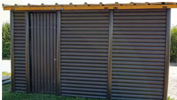
Abri de jardin fermé