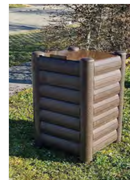
Bac poubelle avec porte-sac intégré