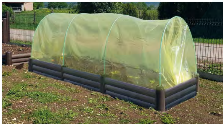
Carrés potagers modulables 3mx1,2m évolutifs en mini-serre